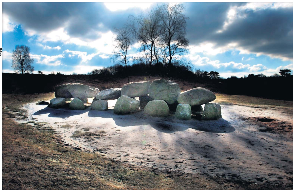
Hunebed bij Havelte.