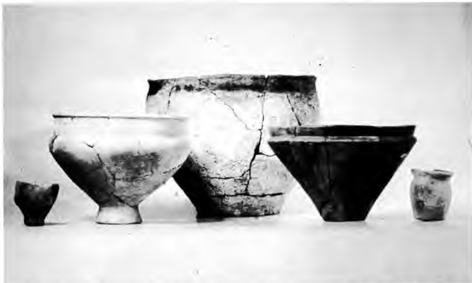
Aardewerk uit de Romeinse tijd; grote voorraadpot en 'serviesgoed' (collectie Biologisch-Archeologisch Instituut)

zijn als vergelijkingsmateriaal. Het erf Derkinge bleek onregelmatig van vorm te zijn en was aan drie zijden begrensd door een sloot. De boerderij was vergelijkbaar van bouw en afmetingen met dat op Hovinge. Geheel afwijkend was echter het ontbreken van een grote schuur op dit erf. Weliswaar bevonden er zich enkele mijten of roedenbergen en kleinere schuren op het erf, maar een grote schuur ontbrak. Dit verschil bevestigde de uitzonderlijke positie van Hovinge en de aldaar aangetroffen schuur zou wellicht als tiendschuur kunnen worden betiteld, waarin niet alleen de opbrengst van het eigen bedrijf werd ondergebracht, maar ook de pacht in natura van Derkinge en andere bezittingen in de omgeving. Van de boerderij Derkinge is nog interessant te vermelden, dat daarin voor het eerst in een opgraving de resten van potstallen zijn aangetroffen. Daaruit blijkt dat men omstreeks 1300 al bezig was met het bewust verzamelen van mest voor de akkers. Daarmee is het begin van de es bepaald, hetgeen