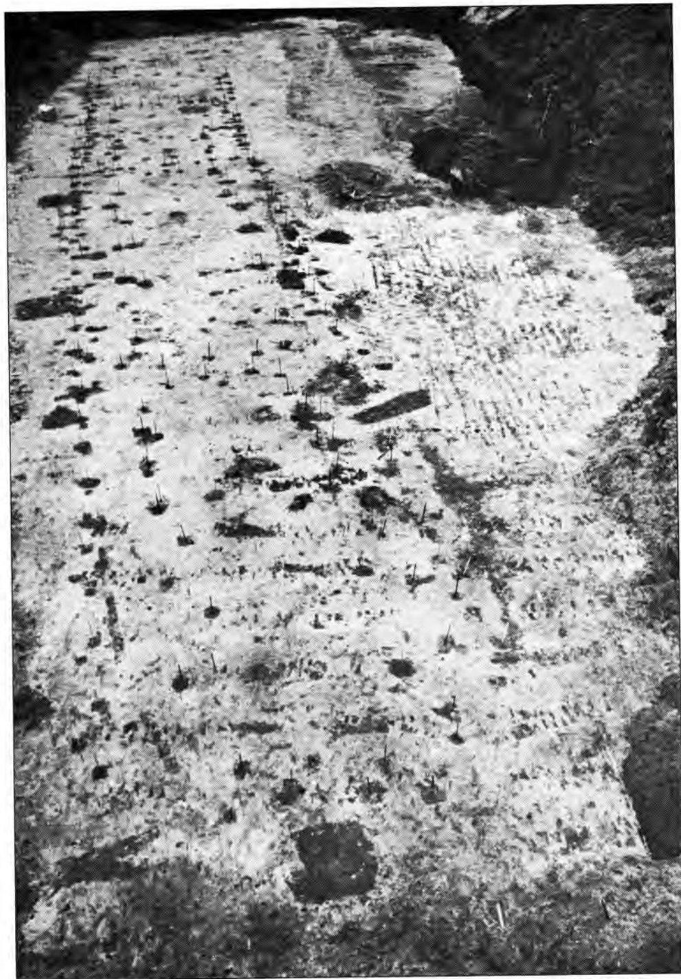
Opgravingsfoto van de es. Hier zijn verschillende grondsporen uit drie perioden te zien, namelijk krassen van een ploeg uit de IJzertijd (midden-rechts), een huisplattegrond uit de Romeinse tijd (van boven naar beneden), bestaande uit paalgaten, en ontginningssporen uit de Middeleeuwen, bestaande uit schopsteken (op de voorgrond in horizontale rijen