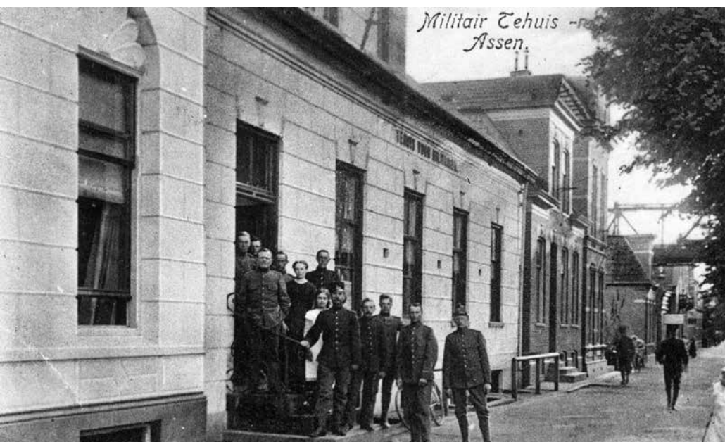
Militair Tehuis aan het begin van de twintigste eeuw.

In hetzelfde jaar 1894 betrokken in Assen vier compagnieën van het Eerste Regiment Infanterie de nieuwe Wilhelminakazerne. In de jaren daarna volgden de Emma- en Hendrikkazerne en werd Assen een van de belangrijkste Nederlandse garnizoensplaatsen.