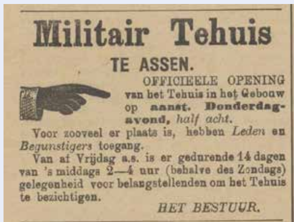
Provinciale Drentsche en Asser Courant, 6 november 1894.