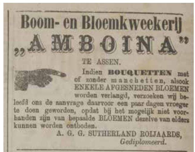
Provinciale Drentsche en Asser Courant, 8 februari 1878.