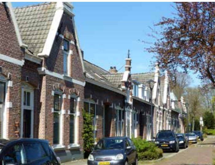
Het aan de voorkant gaaf bewaard gebleven Gasfabriekstraat-complex van architect Taeke Boonstra is sinds 2008 een gemeentelijk monument.