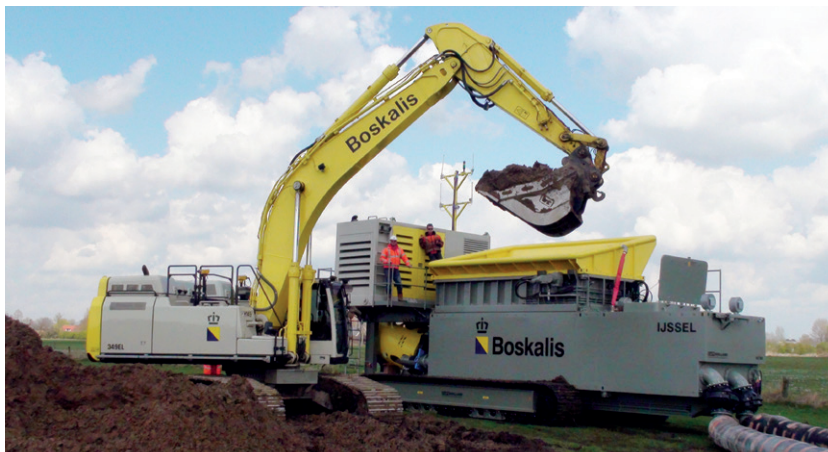
In maart arriveerde de grondpers in Fortmond en kon Boskalis beginnen met het inregelen van de apparatuur.

De Combinatie IJsseluiterwaarden Olst heeft een eigen nieuwsbrief om bewoners en andere betrokkenen van de uitvoering van het project op de hoogte te houden. Wie die nieuwsbrief niet ontvangen heeft en er belangstelling voor heeft, kan een mailtje sturen naar olst@boskalis.com .