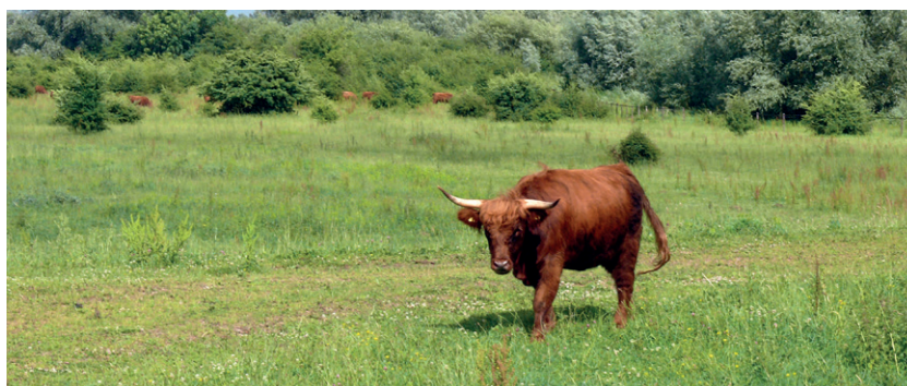
Schotse hooglanders in de Duursche Waarden.

In Infocentrum IJssel Den Nul (Rijksstraatweg 109, 8121 SR Den Nul) vindt u alle informatie over de Duursche Waarden. Meer weten? Kijk op www.staatsbosbeheer.nl of www.infocentrumijssel.nl . U vindt hier binnenkort ook details over speciale activiteiten ter gelegenheid van het 25-jarig jubileum van dit natuurgebied van Staatsbosbeheer.